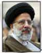
ریاست قوه قضائیه: رفع موانع تولید از محور جای جدي کار دستگاه قضایه است