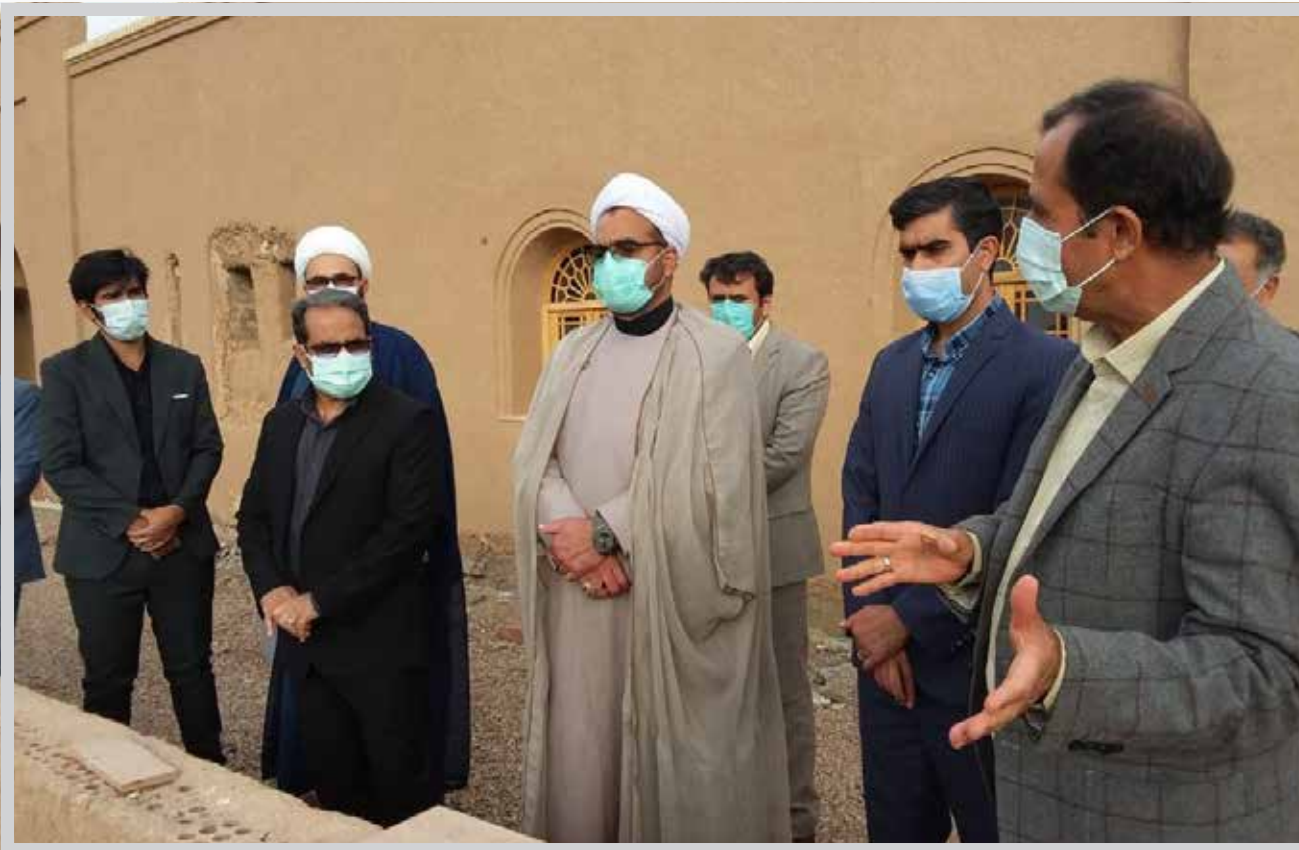
معاون رییس کل دادگستری استان کرمان مطرح کرد: