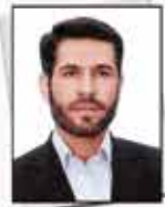
معاون رئیس قوه قضائیه: قوه قضائیه گام جای ریشه ای برای حل مشکلات تولید برداشته است