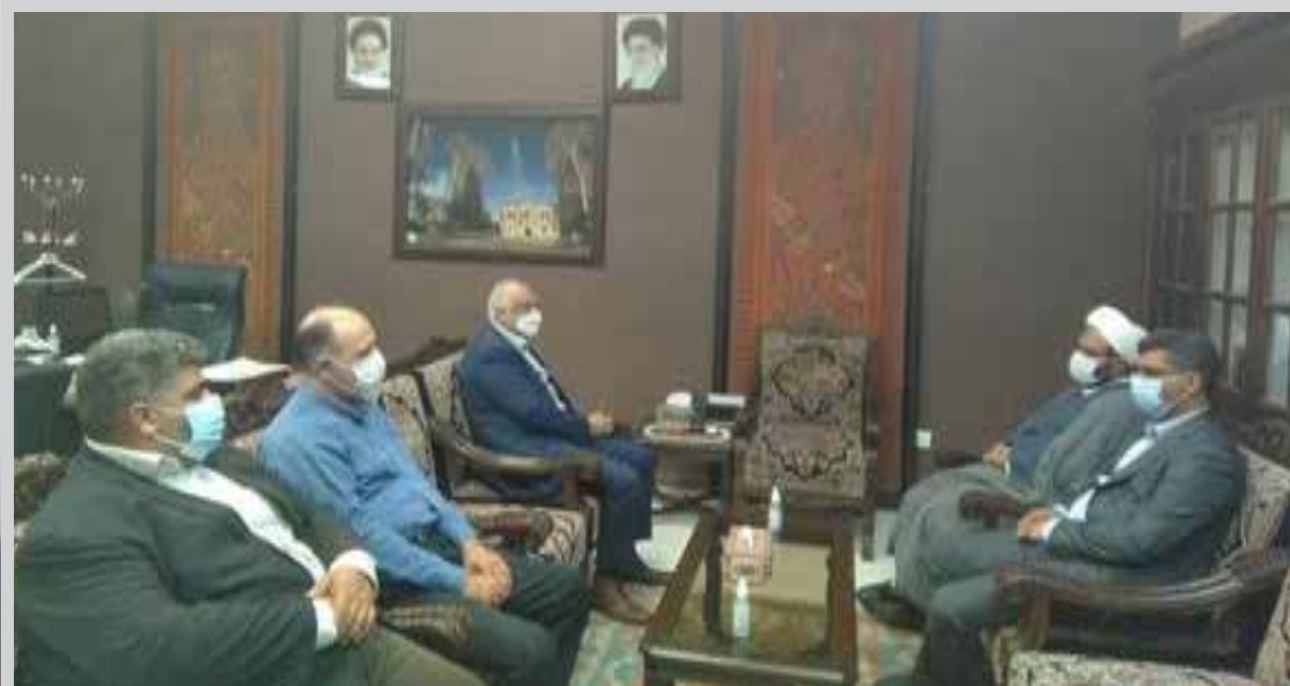
رئیس حوزه قضایی ماهان: