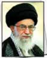
مقام معظم رهبری: حاشیه نشین ها محصول و ضرر ناسامان روستاها است