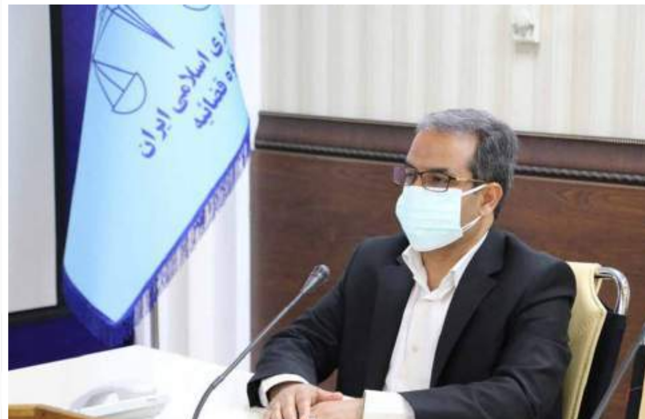
معاون اجتماعی و پیشگیری از وقوع جرم دادگستری کل استان کرمان: