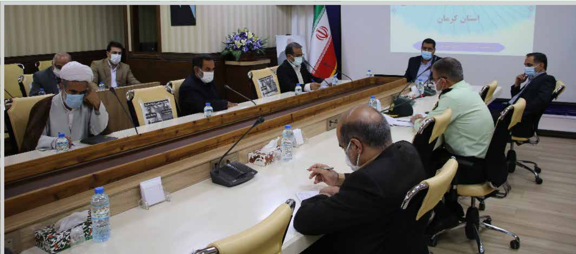
رئیس کل دادگستری استان کرمان تاکید کرد: